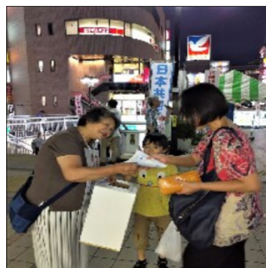
松戸駅での募金活動

口座名義「日本共産党千葉県委員会」。通信欄には「台風災害救援募金」とお書き下さい（原・松）