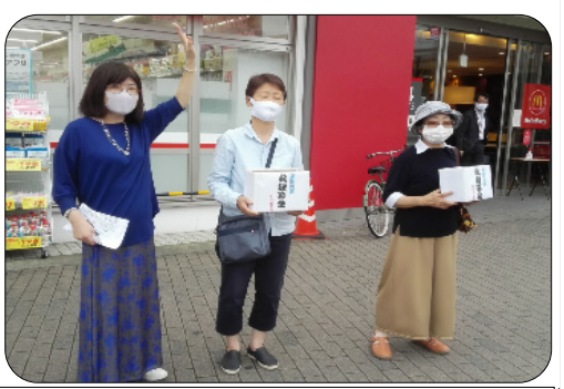
豪雨被災地域への募金活動