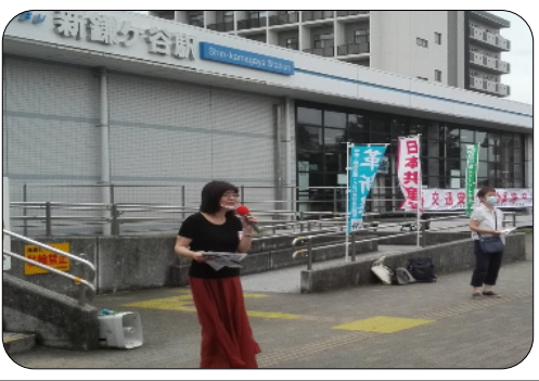
オスプレイ来るな！を訴えています！