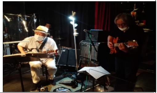
感染予防対策の元ライブ活動ちょっと再開！

丁寧な回答書をいただくことが出来ました。紙面の都合上、内容の詳細はお伝えできませんが、来る8月20日(木)の午後から、「市政報告会」を中央公民館にて開催する予定ですので、是非そちらにご参加ください。(詳細は後日お知らせします！)